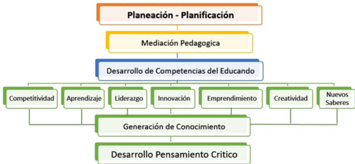
Gráfica No. 1. Mapa mental del desarrollo de las competencias y generación de conocimiento con pensamiento crítico. Elaborado por los autores.

académicos que buscan continuamente respuestas en medio de los paradigmas y los ambientes reales de aprendizaje.