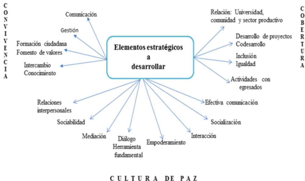
Gráfico 2. Sistematización del Modelo

Esta multidimensionalidad, permite la generación de espacios comunicativos donde la convivencia aparece como el ámbito privilegiado donde se focaliza la acción. Así mismo, una institución educativa para que realmente sea una comunidad participativa, debe promover desde su gestión canales de comunicación efectivo que permite la difusión y el intercambio con la intención de construir espacios propicios al diálogo y la reflexión, favoreciendo con eso, acciones creativas de normas y principios definiendo los valores y regulaciones necesarias para su funcionamiento pertinente.