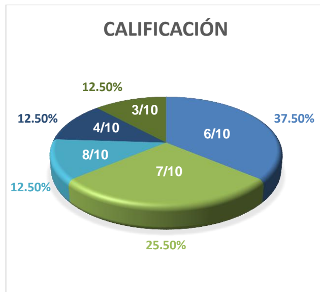
Gráfico 9: Calificaciones evaluativo N°8

Siguiendo con el análisis de la octava evaluación, la cual tuvo un 90% de participación estudiantil, el 12,5% de la clase sobresalió con una calificación de 8 puntos, mientras que el 25% y el 37,5% aprobaron con 7 y 6 puntos. El 25% restante reprobó la prueba con puntuaciones entre los 4 y los 3 puntos.