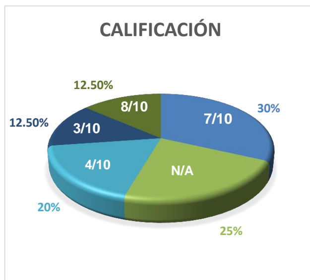
Gráfico 3: Calificaciones evaluativo N°2

En cuanto al segundo interrogatorio correspondiente a la evaluación de la segunda parte de la historia del Canal de Panamá, hubo un incremento en el porcentaje de estudiantes que calificaron con puntuaciones sobresalientes; un 30% de la clase aprobó con 7 puntos, mientras que un 12,5 % calificó con una puntuación de 8. Sin embargo, el 32,5% de la clase reprobó con puntuaciones entre 4 y 3. El 25% restante de la clase no aplicó la prueba por inasistencia.