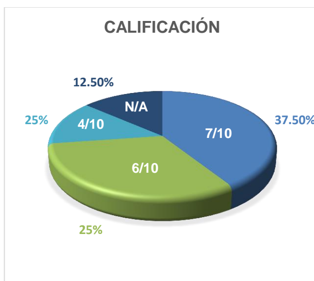
Gráfico 8: Calificaciones evaluativos N°7

En cuanto a la séptima evaluación, la cual abarco los objetivos correspondientes a las relaciones comerciales del canal de Panamá, tuvo una participación de un 87,5% de la clase, de los cuales el 37,5% aprobó con 7 puntos, el 25% con 8, y el 25% restante reprobó con 4 puntos.