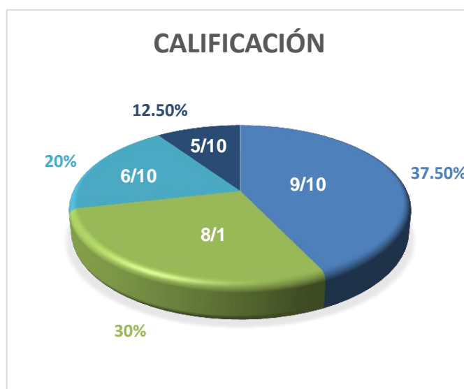
Gráfico 6: Calificaciones evaluativo N° 5

Conforme al quinto interrogatorio, donde se evaluó lo concerniente a los socios comerciales del canal de Panamá, un 50% de la clase aprobó con calificaciones entre 8 y 6 puntos, mientras que un 12,5% aprobó con lo necesario, 5 puntos. El 37,5% restante sobresalió con una calificación de 9 puntos. En esta oportunidad el 100% de la clase aprobó el interrogatorio e incluso hubo un incremento en las calificaciones sobresalientes.