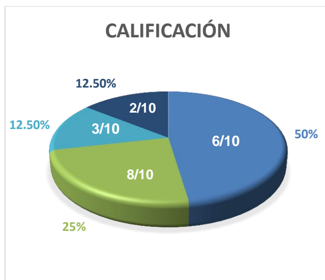
Gráfico 4: Calificaciones evaluativo N°3

Lamentablemente, el 25% restante de la clase reprobó el interrogatorio, algunos con 3 puntos y otros con 2. Los estudiantes comunican que más allá de lo fluida de la clase y el buen intercambio de comunicación muchos se desaniman por motivos ajenos y esto irrumpe en el índice académico.