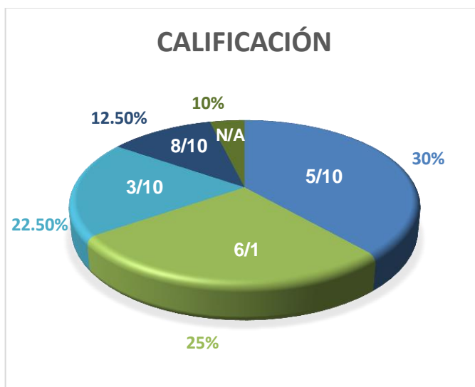
Gráfico 7: Calificaciones evaluativo N°6

Correspondiente a la sexta evaluación, abordó la temática de la importancia del canal de Panamá, tuvo una participación del 90% de la clase; un 12,5% de la clase aprobó con una calificación sobresaliente de 8, mientras que un 25% lo hizo con 6 puntos. Un 30% de la clase aprobó la evaluación con 5 puntos, y el restante 22,5% de la clase la reprobó con 3 puntos.