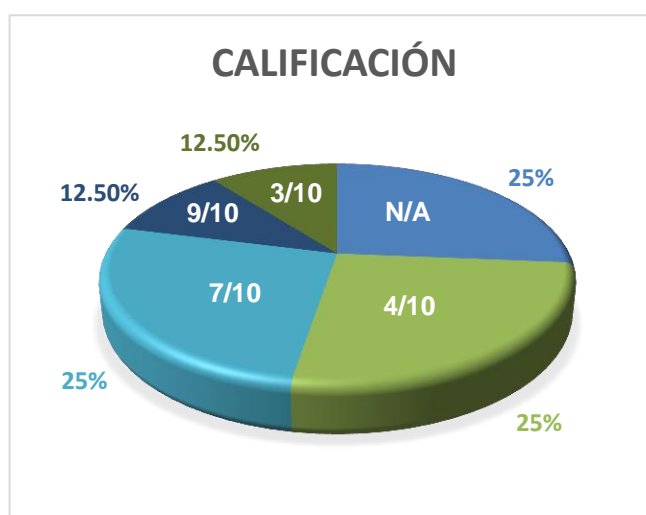
Gráfico 5: Calificaciones evaluativo N°4

En referencia al cuarto interrogatorio, el cual evaluó la última parte de la historia del Canal de Panamá, contó con un 75% de participación por parte de los estudiantes de los cuales el 25% aprobó con 7 puntos, un 12,5% sobresalió con calificación 9, un 25% reprobó con 4 y un 12,5% con 3. En esta evaluación aumenta drásticamente el porcentaje de estudiantes reprobados, sin embargo, la calificaciones altas son ahora más sobresalientes.