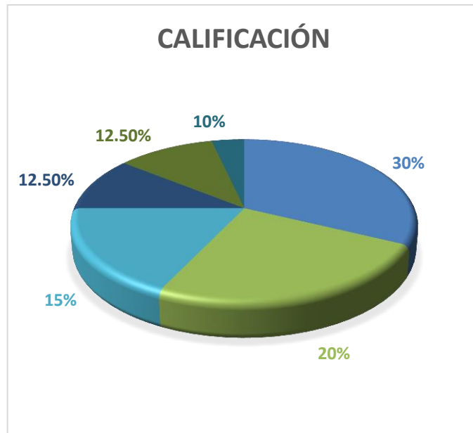
Gráfico 10: Calificaciones evaluativo N°9

Por último, en la aplicación de la prueba escrita, donde se evaluó todo el contenido, desarrollado en los 24 encuentros, hubo una participación del 100%. Un 25% sobresalió con calificaciones entre los 8 y 7 puntos, mientras que un 50% aprobó con calificaciones de 6 y 5 puntos. El 25% restante reprobó la evaluación final, con puntuaciones de 4 y 3 puntos.