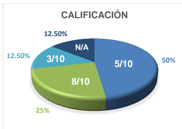
Gráfico 2: Calificaciones evaluativo Nº 1

Como resultados de la primera evaluación aplicada a los 40 estudiantes de la cátedra de Operaciones del Canal, corresponde a un interrogatorio didáctico sobre la primera parte de la historia del Canal de Panamá. En esta prueba se obtuvieron resultados dispares; el 50% de la clase calificó apenas con una puntuación de 5, un 25% resaltó con una calificación de 8 y un 12,5% de la clase reprobó el interrogatorio con una puntuación de 3. Asimismo, el 12,5% restante no asistió a la evaluación. Si bien la temática era de fácil manejo y la dinámica del interrogatorio resultó fluida, muchos estudiantes no estaban lo suficientemente preparados para la evaluación.